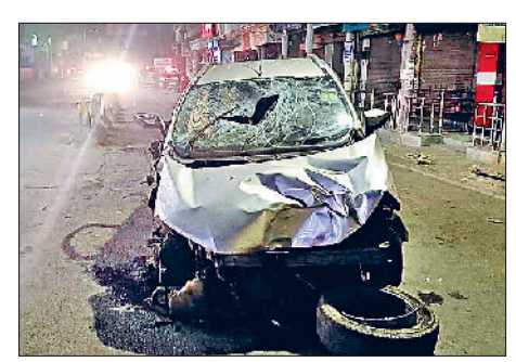
सोनीपत। हादसे के बाद क्षतिग्रस्त गाड़ी।

सिविल लाइन थाना क्षेत्र के मामा-भांजा चौक पर तेज रफ्तार कर कर देखने को मिला। तेज रफ्तार ईको स्पोर्ट्स कार चालक ने साइकिल व स्कूटी पर काम से घर लौट रहे नेपाल के रहने वाले पांच युवकों को चपेट में ले लिया। हादसे में साइकिल व स्कूटी सवार चार नेपालियों की मौत हो गई और साइकिल सवार नेपाली समेत कार चालक व उसके दो साथी गंभीर रूप से घायल हो गए। घायलों को नार्थिक अस्पताल में भर्ती कराया गया, जहां से उन्हें पीजीआई रोहतक रेफर कर दिया। पुलिस ने दो के शवों का पोस्टमार्टम करवाकर परिजनों को सुपुर्द कर दिया। हादसे में दो के परिजन अस्पताल में नहीं पहुंचे।