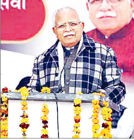
पानीपत। लोगों को संबोधित करते मुख्यमंत्री मनोहर लाल।